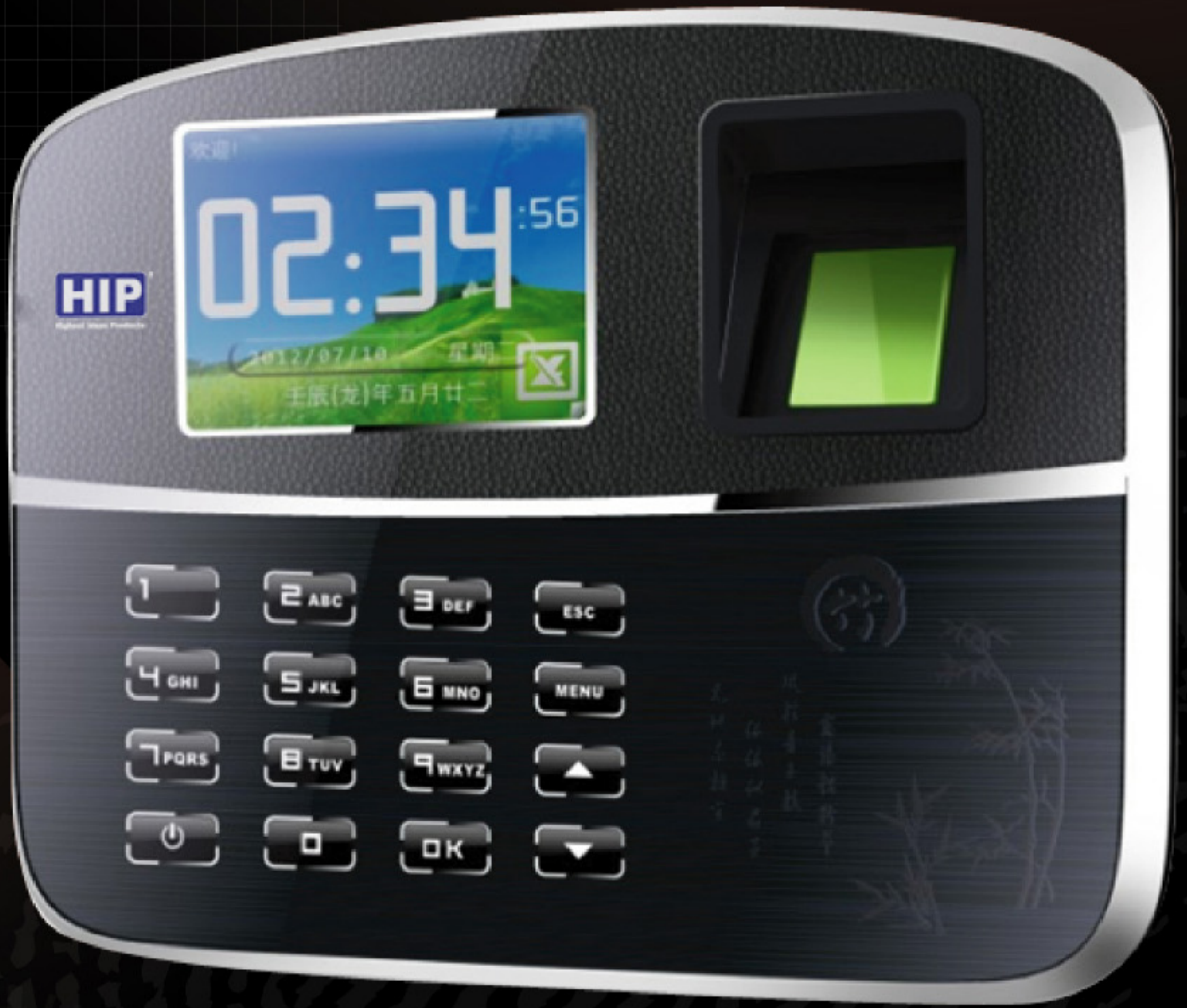
Standalone Fingerprint Time Attendance Color Screen System